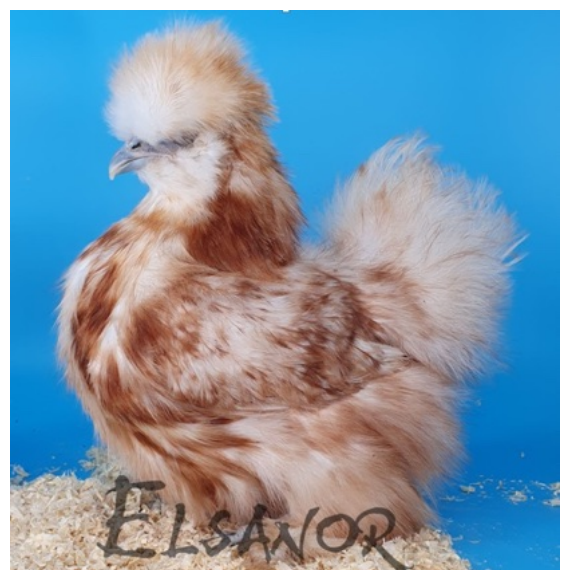
Poule soie blanc panaché rouge