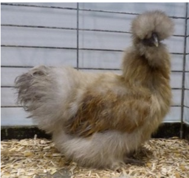
Poule soie perdrix blanc doré

La CES-V se montre réservée sur ces 2 dernières races et demande à la France des photos. ce qui a été fait.