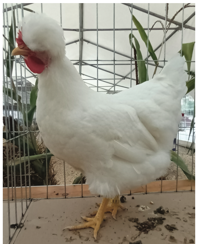
Poule huppée de Sombor blanche